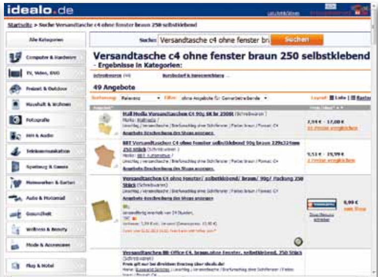
Auch ohne EAN wird man (meist) fündig