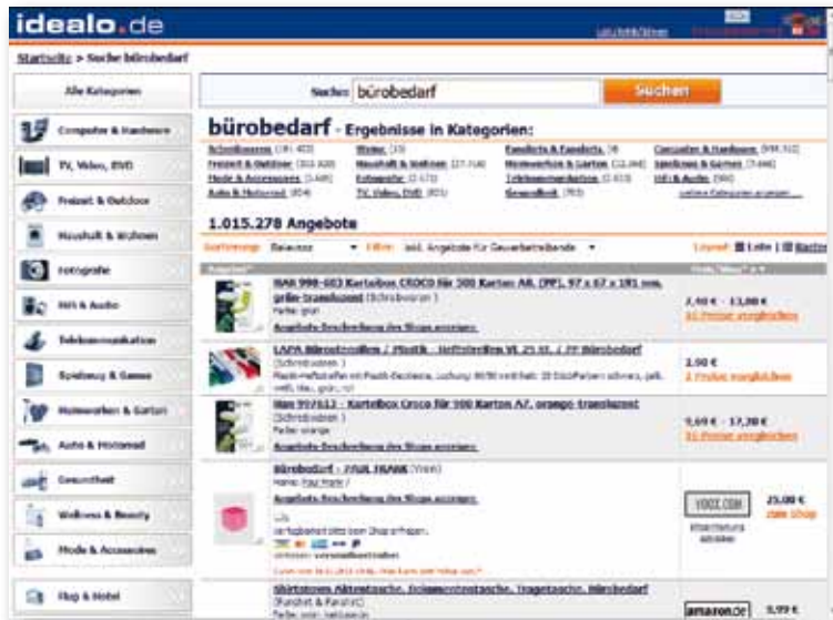
Über eine Million Angebote für Bürobedarf auf Idealo.de