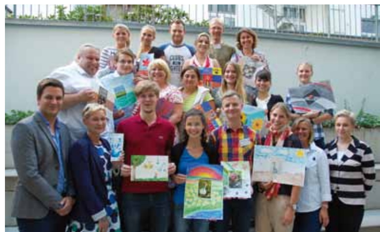
Zufriedene Kursteilnehmer: Gruppenfoto vom Abschlusstag des 2012 gestarteten Kurses