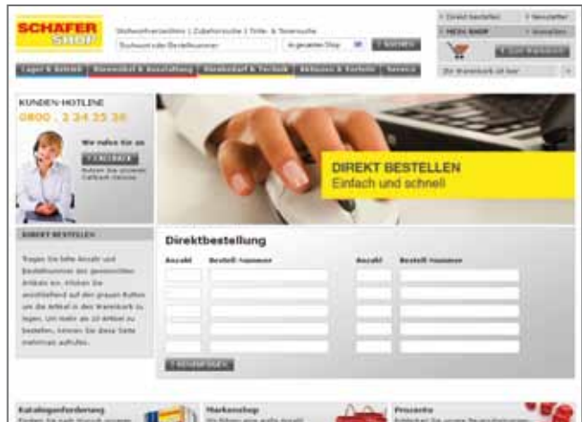
Zuerst die Menge, dann die Artikelnummer – abweichende Schnellbestellung bei Schäfer Shop

alleingelassen: „HP Multifunktionsgerät“ führt zu 15 Treffern die in die Produkttypen Multifunktionsgeräte, Bürozubehör, Technologie-Produkt, Multifunktionsgerät(!) und Drucker weiter aufgegliedert werden. Hier ist sicher noch Katalog-Pflegearbeit möglich. Schäfer Shop als Vergleichs-Anbieter hat ein übersichtlich gegliedertes und breites Angebot, mit vielen Alternativen speziell bei den großen und teuren Geräten.