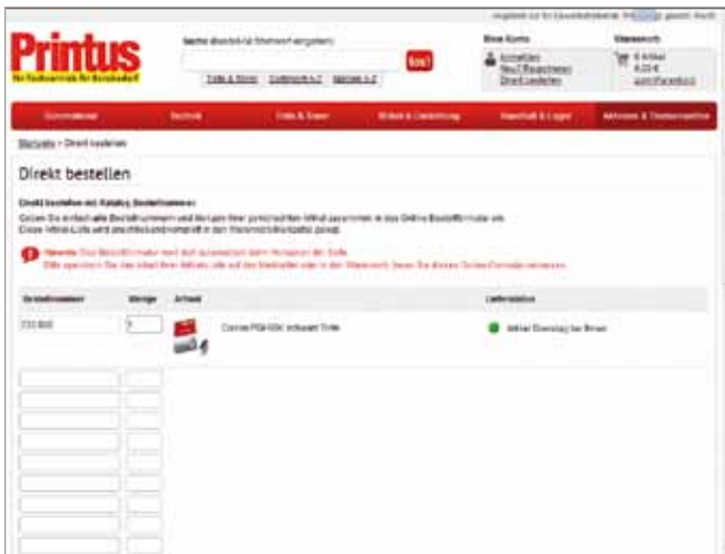
Erhöhter Komfort bei der Bestellung nach Artikelnummern – Printus zeigt sofort die Artikel mit Verfügbarkeit.