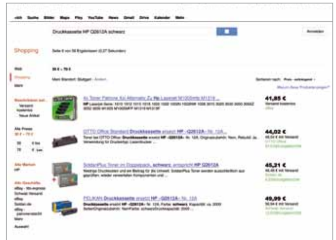
Trotz Auswahl „nur Marke HP“ werden bei Google Shopping auch kompatible Produkte mit angezeigt.

schon heute über jeden Benutzer ermittelt, bekommt hier nochmals einen klaren Hinweis darauf, dass ein Einkauf über Google dem eigenen Profil noch viele weitere interessante Daten hinzufügt.